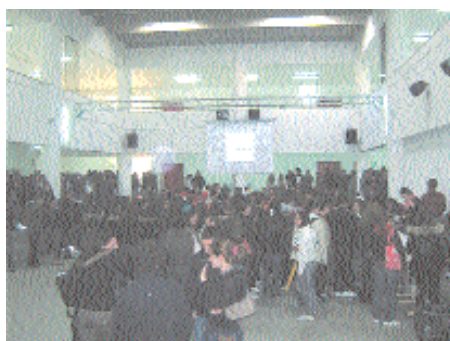
Studenti del liceo in assemblea

Mancano pochi giorni ormai alla fine di questo meraviglioso anno. Sai caro liceo? mi mancherai! Mi mancherà quella piacevole atmosfera che si respira dentro le tue mura. Per quanto le materie scolastiche da affrontare giornalmente fossero difficoltose e, anche un po' noiose, non si può oltrepassare la tua soglia con il "muso" e subito un'atmosfera magica ed incantata ti prende e ti avvolge. Perché, caro mio liceo, davvero provochi questo effetto appena ti si avvicini. Mai come quest'anno studiare è diventato un vero piacere, non è stato