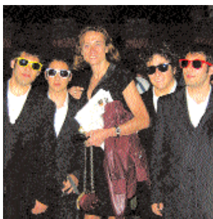
I complimenti di Vladimir Luxuria