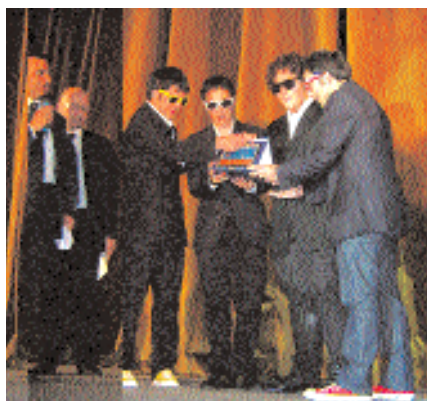
Il momento della premiazione

Allora che dire ragazzi?! Presto vi vedremo sui grandi schermi!?