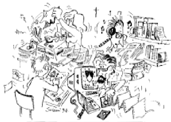
Ketronia: Redazione e allievi