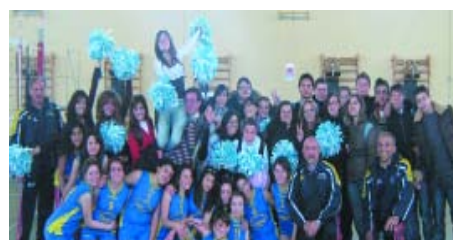
Dopo la gara