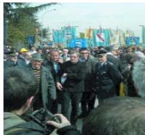
L'arrivo di Don Luigi Ciotti a Casal di Principe