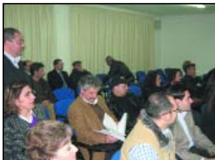
Ex garofaniani in assemblea

Sabato 28 marzo scorso, nei locali del Liceo Garofano, si è concretizzata quella che il 13 dicembre 2008, in occasione della commemorazione del trentacinquennale della fondazione del prestigioso liceo capuano, fu annunciato a tutti gli ex, sia studenti che professori, accorsi per l'occasione.