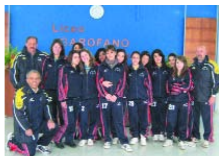
Prima della gara