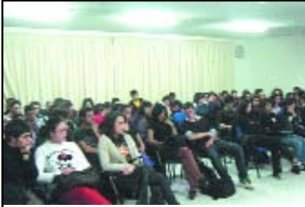
Un momento degli incontri

Continuano gli incontri organizzati dal Coordinamento locale della Consulta Provinciale degli Studenti (CPS) sul tema "I giovani e la legalità".