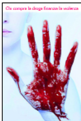
Che sempre le droghe favoriscano la violenza

Il Liceo Garofano è contro il fumo, l'alcool e le droghe e promuove il programma educativo contro gli eccessi: