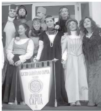
Il gruppo storico del Garofano

Oltre ai viaggi nello spazio, il Liceo Garofano è impegnato in un interessante viaggio nel "tempo". Nasce quest'anno, infatti, al "Garofano" il primo gruppo storico della Città di Capua. Un viaggio nel tempo che parte da Casilinum nell'856 e intende ripercorrere, attraverso i personaggi storici che maggiormente hanno rappresentato le varie epoche, la storia, o meglio "le storie di Capua". Gli abiti, preziosi manufatti rigorosamente di origine sartoriale realizzati da sartorie artigianali locali, sono realizzati con stoffe importanti e monili ricercati, e sono frutto di una intensa e rigorosa ricerca storica. Il gruppo, che assume il nome provvisorio "le storie di Capua", da questo nucleo originario di otto personaggi (Conte Landolfo e consorte, Federico II con con-