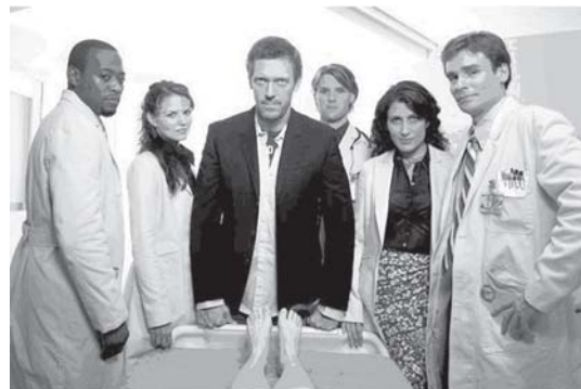
La famosa serie televisiva: "Doctor House"

E allora, domandiamoci: dov'è che dovremmo tagliare? Sul Superfluo o sul Necessario ? Purtroppo il mercato è sovrano, anche se la nostra Costituzione, ovviamente sovietica, detta che l'iniziativa economica è privata e libera, ma... non può svolgersi in contrasto con l'utilità sociale (art. 41). Ma chi pon mano ad essa? Sanremo continuerà a sorprenderci per lo share ! E i nostri bambini avranno una scuola sempre peggiore! A meno che...! Ma la partita è molto difficile!