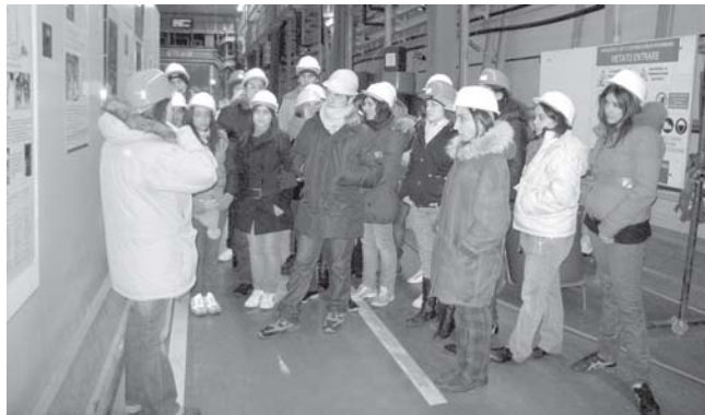
Un momento della visita alla centrale

cui partecipa finanziando tecnologia e personale utilizzato. I laboratori sono allestiti, in tre grandi sale sotto circa 1400 metri di roccia, buon riparo per i raggi cosmici (1/1.000.000 rispetto alla superficie), una quindicina di esperimenti quasi tutti dedicati sia allo studio dei neutrini come particelle che alle informazioni che essi trasportano. I neutrini, costantemente prodotti nei processi che coinvolgono molti decadimenti radioattivi e di fusione termonucleare nelle stelle, viaggiano quasi alla velocità della luce, sono di tre tipi (elettronici \nu_e - muonici \nu_\mu - tau \nu_\tau ) ed oscillano, si trasforma-