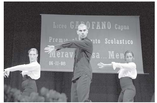
Momento di danza