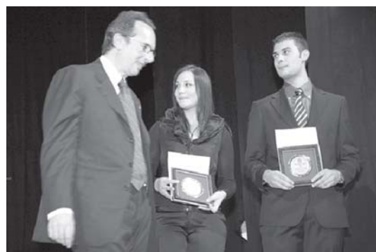
Il Presidente della Provincia De Franciscis con due alunni

carenza di questo impianto produttivo, è a corto di risorse”. A chi, invece, sostiene un allontanamento dei giovani dalla cultura risponde così: “Non pensate che la cultura e i giovani si siano distanziati. La nostra gioventù ci fa ben sperare per il futuro. C’è bisogno di un impegno costante e costruttivo, dell’aiuto dei docenti e delle famiglie, perché senza le famiglie la scuola purtroppo non riuscirà mai a costruire né realizzare completamente il suo compito educativo e formativo e le istituzioni soprattutto devono capire l’urgente necessità sociale di investire nella cultura”.